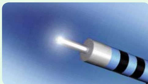
Marquage, incision/dissection et coagulation à l'aide de la pointe d'électrode HF