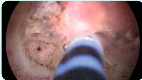
Résection en bloc d'une tumeur de la vessie