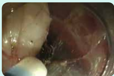
Résection tumorale après la création d'un tunnel

L'instrument HybridKnife est aussi l'outil de choix pour la myotomie perorale endoscopique (POEM) . La combinaison de la fonction HF et de la fonction de jet d'eau permet la création sélective et adaptée d'un tunnel jusqu'au sphincter œsophagien inférieur et au-delà après l'élévation et l'incision de la muqueuse. Après la myotomie de la couche musculaire circulaire, la coupe est recouverte par la muqueuse intacte et le point d'incision est refermé au moyen de clips. 4-6