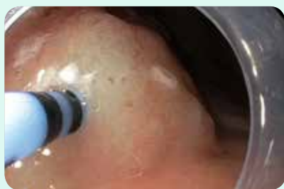
Élévation avant l'ESD

Les fonctions de chirurgie par jet d'eau et de chirurgie HF intégrées à l'instrument HybridKnife permettent de nouvelles procédures d'endothérapie dans le domaine de la gastroentérologie. La fonction d'élévation disponible à tout moment avant la résection ou la création d'un tunnel ainsi que les multiples fonctions chirurgicales HF apportent des avantages décisifs.