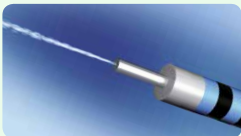
Élévation avec la fonction de jet d'eau