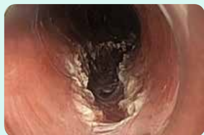
La couche musculaire après la myotomie

Des tumeurs étendues peuvent ainsi être traitées par une résection R0 «en bloc» de manière non invasive et efficace. L'élévation permet de protéger la couche musculaire de toute perforation mécanique et thermique. 1-3