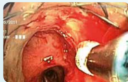
Kryo-Devitalisierung Zur Ablation von Gewebestrukturen.