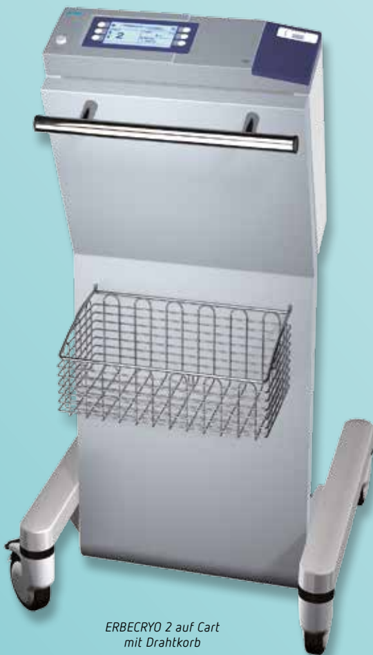
ERBECRYO 2 auf Cart mit Drahtkorb

Mit der Kryo-Rekanalisation werden exophytische Stenosen, Fremdkörper und Blutkoagel sofort beseitigt, der Patient kann unmittelbar nach dem Eingriff wieder frei durchatmen.