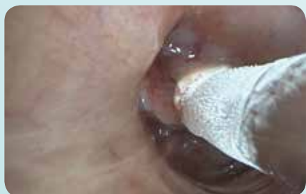
Kryo-Biopsie mit hoher Diagnosewertigkeit Im Vergleich zur Zangenbiopsie ist das Biopsat mit Kryotechnik um ein Vielfaches größer und artefaktfrei.