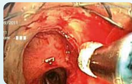
Kryo-Devitalisierung Zur Ablation von Gewebestrukturen.