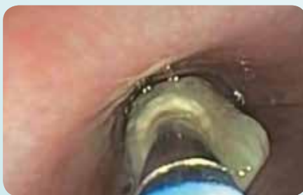
Kryo-Rekanalisation Das stenosierende Gewebe wird mit der Kryotechnik angefroren und extrahiert.